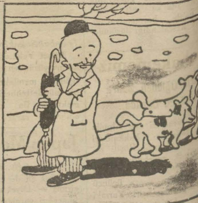
4: Hasan B. — Ooo! Bizim mahallenin dalkavukları savuşuyorlar, darısı memleketin dalkavukları başına!