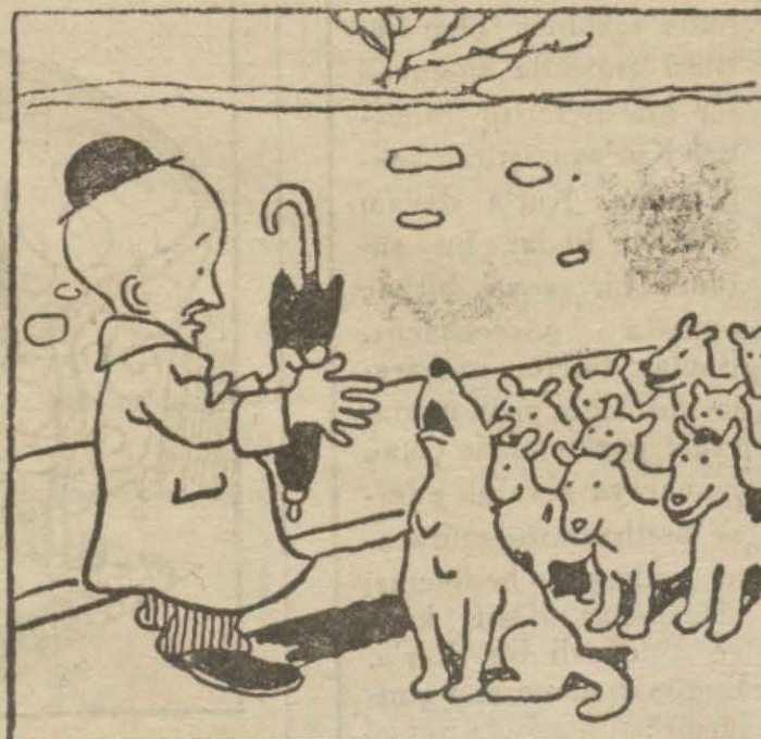
2: Hasan B. — Hayrola "Kıtmir",? Böyle tabur halinde nereye gidiyorsunuz?