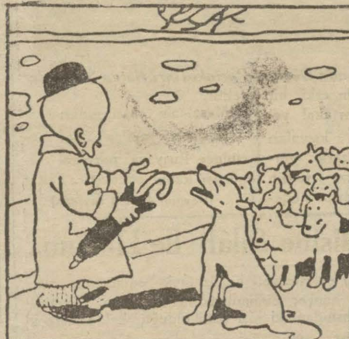
3: Kıtmir — Hasan B., Türkiyede bir lokma ekmek kalmadı, ramazanda bolca iftar eden de yok, biz Mısıra gidiyoruz.