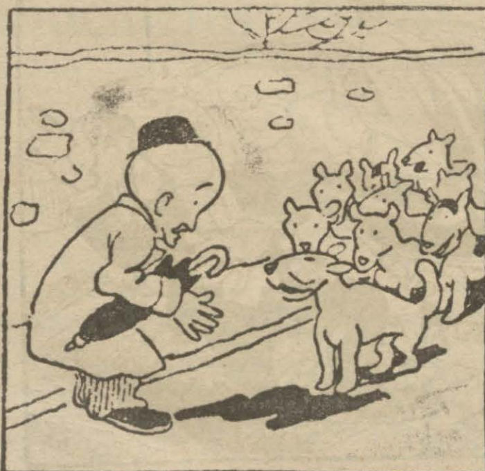
1: Hasan B. — O ne? Bizim mahallenin köpekleri bir tabur teşkil ediyorlar. Dur bakalım hele.