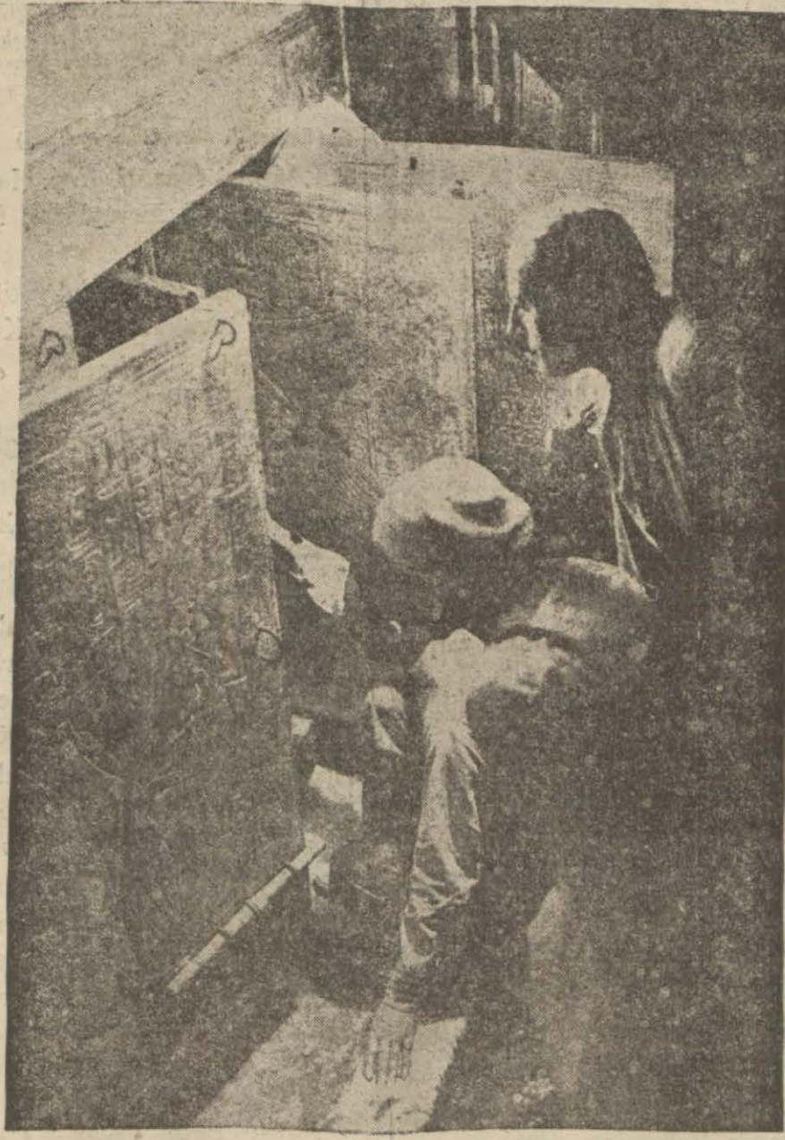
Mısırda keşfedilen kabir açılırken heyecanlı bir dakika.

3000 sene evvelki Mısırın zenginliğini saklayan bu hazinelerin hafriyatı devam edilmektedir.