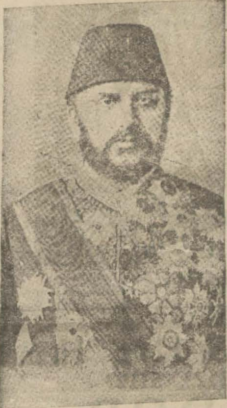
Zamanın Ricalinden Artin Paşa

— Anacığım.. Anacığım... Bu feryat, sanki Hristoforun kulağına saplandı. Koştı. Kalabalığa karıştı. Herkes, on bir yaşlarında bir kızın etrafına toplanmış, onu teselliye çalışıyorlardı. Kız, ağlıyor,