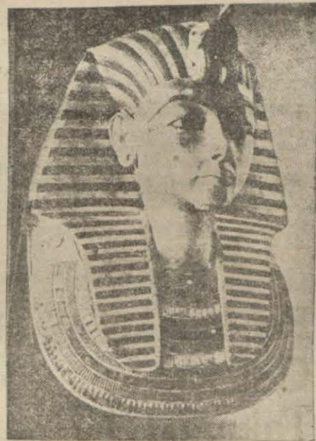
Tutankamenin sandukasındaki resmi.

Bu mezar eski bir Mısır kraliçesine aittir. Bunun da sandukası altındadır.